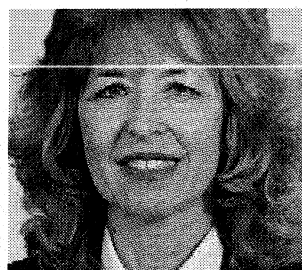
השופטת דניאלה שרזילי

בצעד יוצא דופן הודיעה הפרקליטות כי היא חוזרת בה מכתב האישום שייחס לבני זוג העלמת מס של מיליון שקל. בפרקליטות הסבירו את הצעד בהיעלמות של חומר חקירה ובזמן הרב שחלף מפתיחת התיק